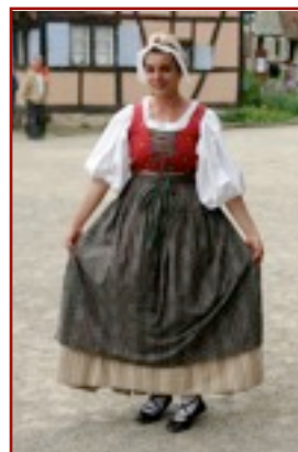
Robe Costume porté vers la frontière suisse. Robe sans manche fermée par un laçage.