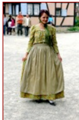
Empire Robe "Empire" de Mulhouse, début XIX e , en coton fleuri : jupe et haut froncé du même tissu, en lieu et place du casaquin et de la jupe de lainage