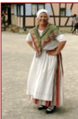
Paysan Costume simple, avec tablier de coton et fichu blanc

Toutes ces pièces de costume sont authentiques ou reconstituées selon les recherches effectuées en collaboration avec la "Commission Costumes" de l'ADATP.