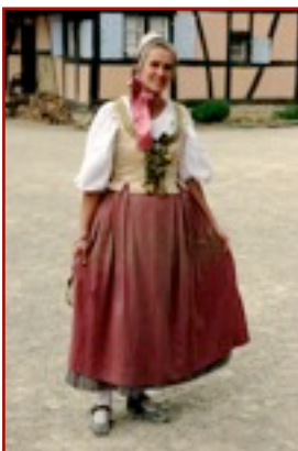
Oltingue Haut sans manches, fermé par des rubans