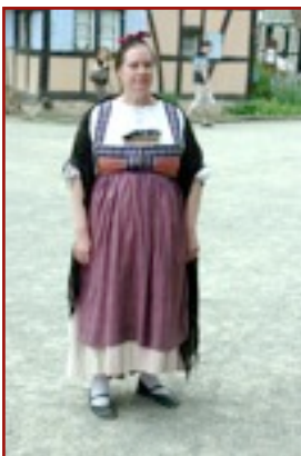
Maraîchère du Ried Robe à bretelles agrémentée d'un "Stecker" et sans bonnet blanc sous la coiffe