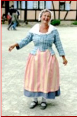
Kelsch, Sundgau, fin XVIII e Casaquin en "Kelsch" : coton rouge et blanc ou bleu et blanc à carreaux (plutôt paysan) caractérisé par ses basques Châle blanc brodé en mousseline de coton