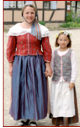
Fleuri, région de Mulhouse, fin XVIII e Casaquin en coton fleuri "Bonnes Herbes" (deux variantes : fermeture droite devant ou avec compères par-dessus, toujours avec des basques) Châle blanc brodé en mousseline de coton